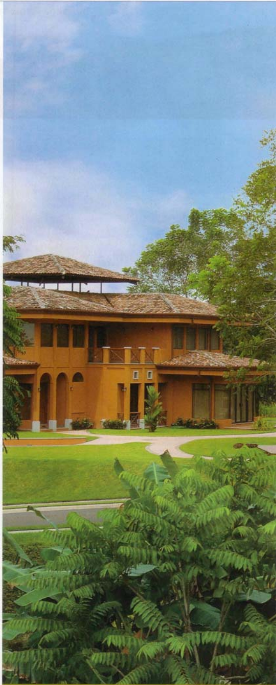
Nativa Resort ofrece a sus inquilinos cientos de aves, plantas y animales, además de un clima semi húmedo con mucho sol y refrescante brisa marina.

Incluye tres dormitorios con aire acondicionado central y dos amplias terrazas con vista al bosque y al mar, ideal para poner a volar la imaginación. La segunda de las casas a la venta es una edificación tipo Town House, con un área de 295 m 2 , tres pisos y tres habitaciones con acabados de lujo.